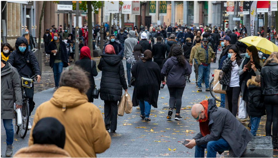
Ook op de Meir in Antwerpen was het dit weekend erg druk.